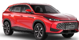
● Diamond Red Metalická farba