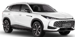
○ White Pearl Metalická farba