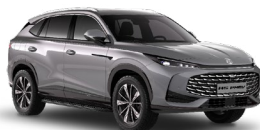
● Hampstead Grey Metalická farba